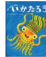
著者: だいたいおのいかたろう 著者: ザ・キャビンカンパニー 出版社: 鈴木出版